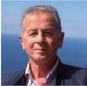
di Maurizio Della Marchina