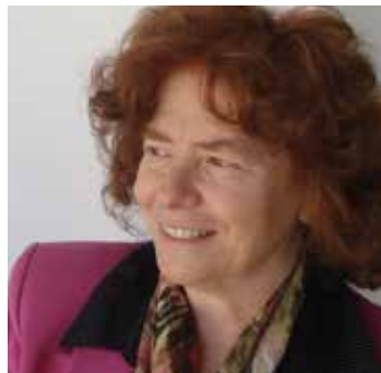
di Laura Baffoni