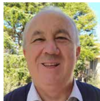
di Mario Agostini