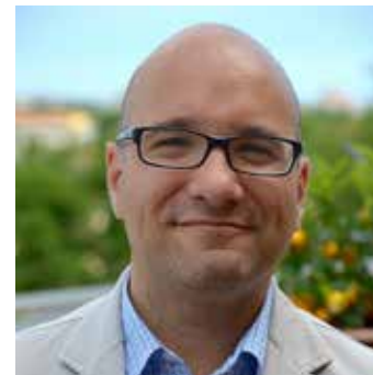
di Davide Saporito