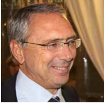
di Emilio Rastelli