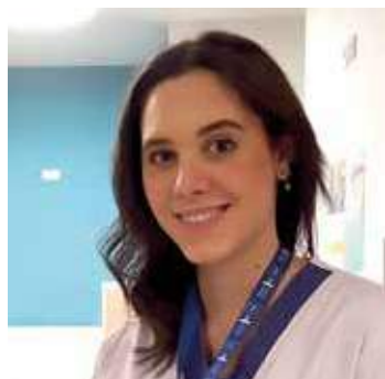
di Laura Ceccarelli