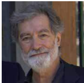
di Mauro Giovanardi