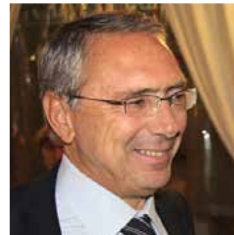
di Emilio Rastelli

[2] https://www.aifa.gov.it/farmaci-carenti