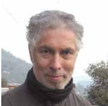
di Gianni Morolli