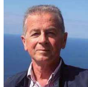
di Maurizio Della Marchina