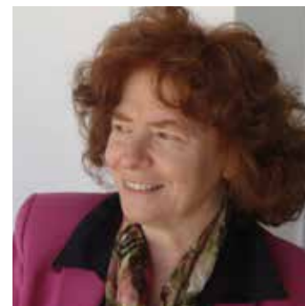
di Laura Baffoni