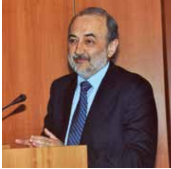
di Maurizio Grossi