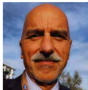
di Marco Grassi

Carenze farmaci. "Situazione critica in tutta Europa"