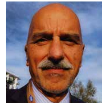
di Marco Grassi

stituito da fibromialgici sia della forma primaria, che secondaria ad altre forme reumatiche. Un malato fibromialgico è ad alto costo economico, infatti consuma risorse pubbliche o private di molto superiori a soggetti con altri dolori scheletrici, pari a un più 40% circa. Importante è indirizzare il malato verso un medico competente a riguardo e soprattutto emotivamente portato a seguirlo, si eviterà che cada preda di trattamenti fantasiosi, dispendiosi e inefficaci.