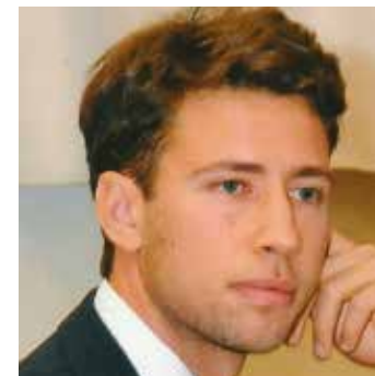
di Mario Bartolomei