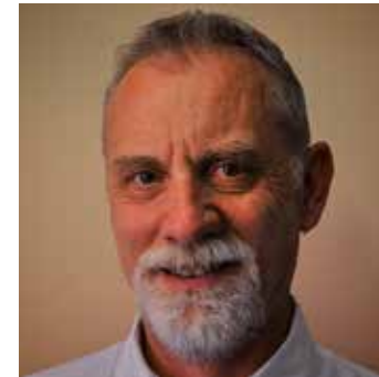
di Luigi Casadei