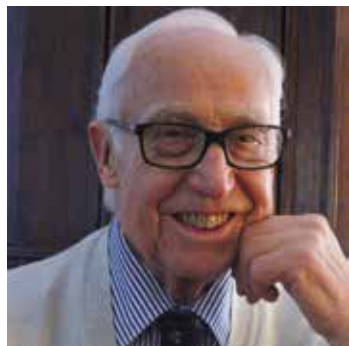
di Franco Magnoni