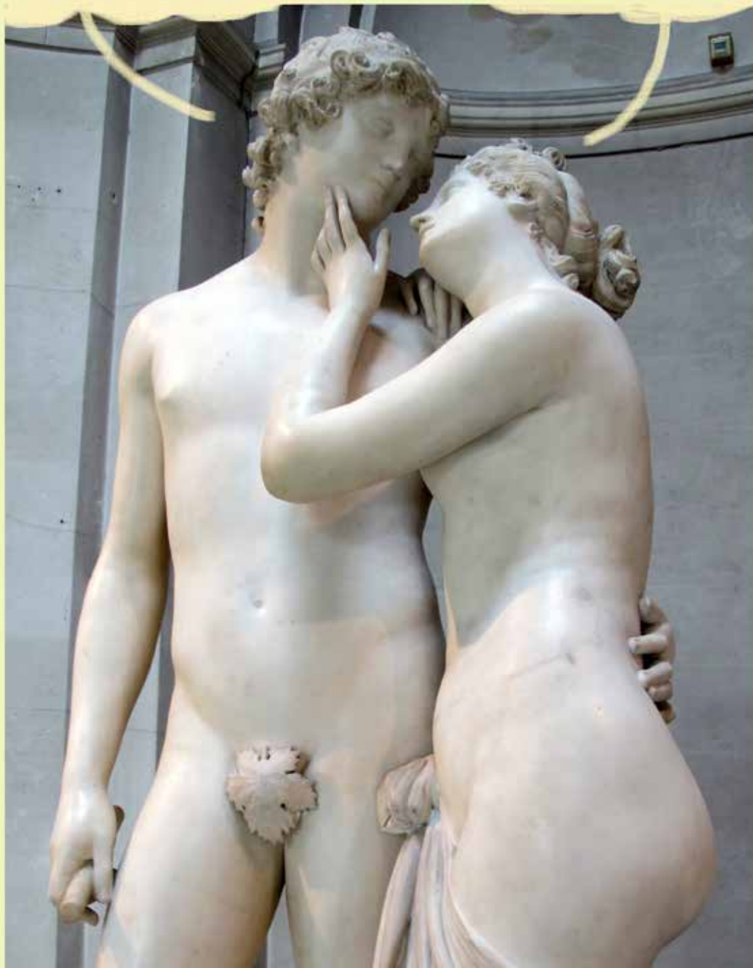
di Luigi Casadei