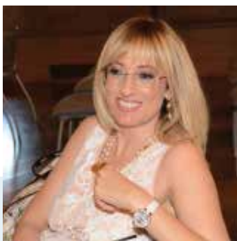
Direttore U.O. Medicina Trasfusionale IRCCS-Ospedale Policlinico San Martino Genova

Direttore Struttura Regionale di coordinamento per le attività trasfusionali-Regione Liguria