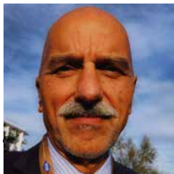
di Marco Grassi