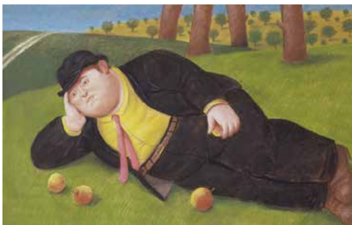
Fernando Botero, Reclined man, 2002; 69×103 cm; Collezione privata dell'artista