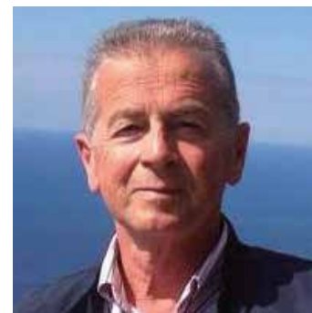
di Maurizio Della Marchina