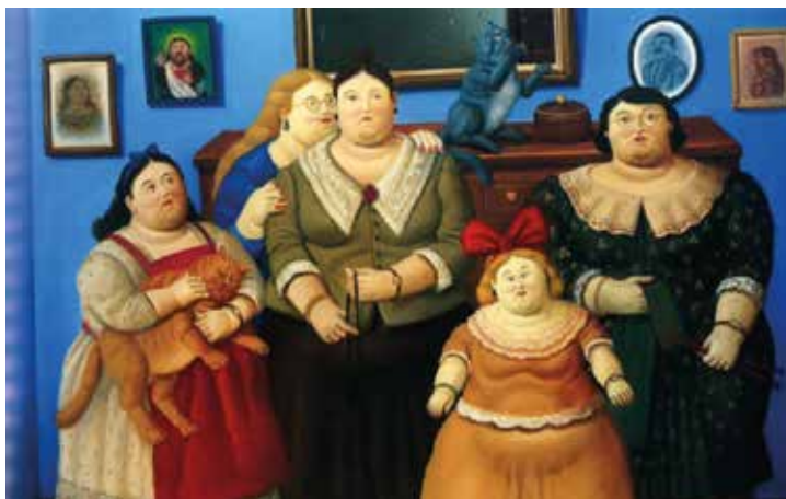
Fernando Botero, Le Sorelle, Le sorelle, 1969-2005 Olio su tela; 173×204 cm

In conclusione, Fernando Botero rappresenta un artista moderno ed unitamente tradizionale, capace di coniugare il proprio stile del tutto personale e la tradizione culturale latinoamericana, con una ricerca visiva caratterizzata da un linguaggio unico ed irripetibile, riconoscibile al primo impatto e con tutta la propria connotazione estetica.