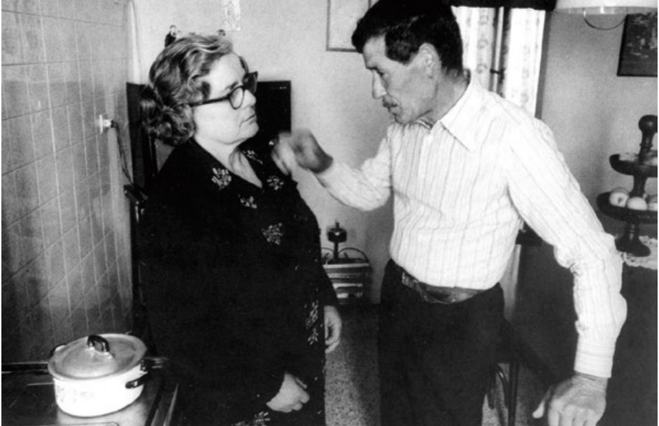
Un guaritore di Cannuzzo di Cervia segna l'erisipela con un anello con una perla. Foto di Giovanni Zaffagnini, 1978.