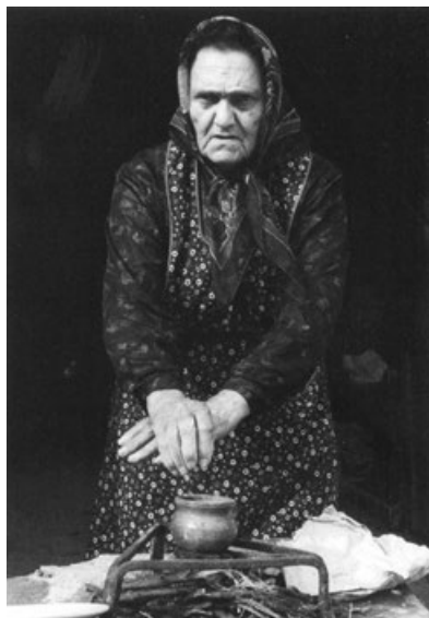
Una guaritrice di Masiera di Bagnacavallo mentre compie il rito per levare il "sinistro". Foto di Giovanni Zaffagnini, 1974.