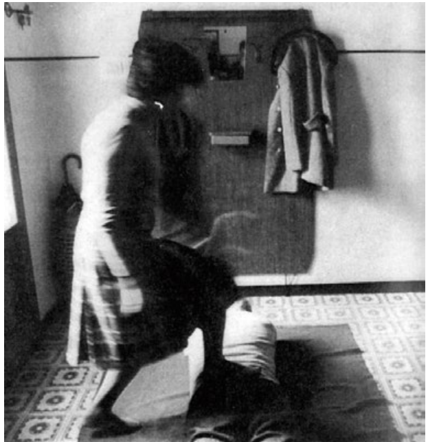
Una guaritrice di Faenza mentre scavalca un malato di lombalgia. Foto di Giovanni Zaffagnini, 1977.