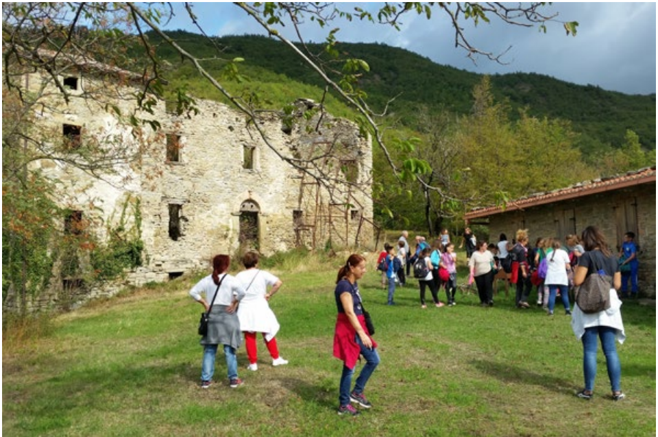
L'arrivo della passeggiata "ecologico-culturale" sul pianoro di Monterotondo; sul fondo le rovine di palazzo Gambetti.